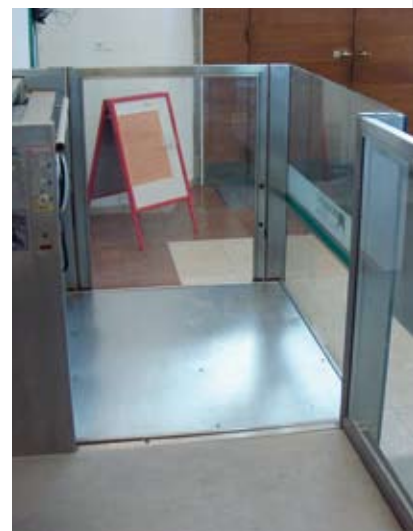
Schöne Umsetzung mit Glaswänden