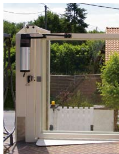
Ausführung mit elektrischem Türöffner